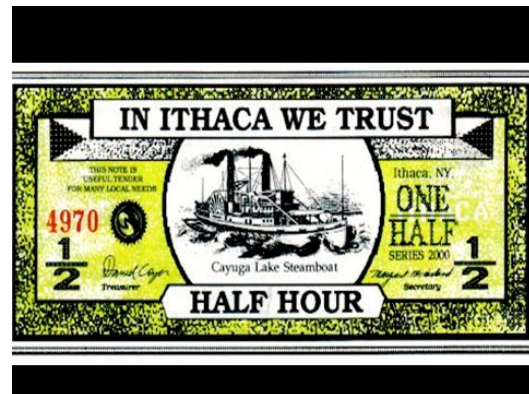
New York-i helyi pénz