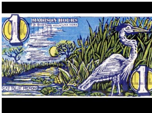
Wisconsin, Egyesült Államok helyi pénz

Előadásában bemutatott helyi pénzeket, felhívta a figyelmet, azok előnyeire, pl. gyarapítja a helyi termelők, szolgáltatást nyújtók munkáját, a közösséget erősíti, közelíti a termelőt, a kereskedőt a fogyasztót, stb. Íme néhány helyi pénz: