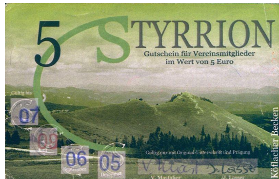
Osztrák helyi pénz