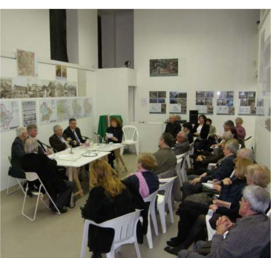
meghívtak és a közönség a konferencián