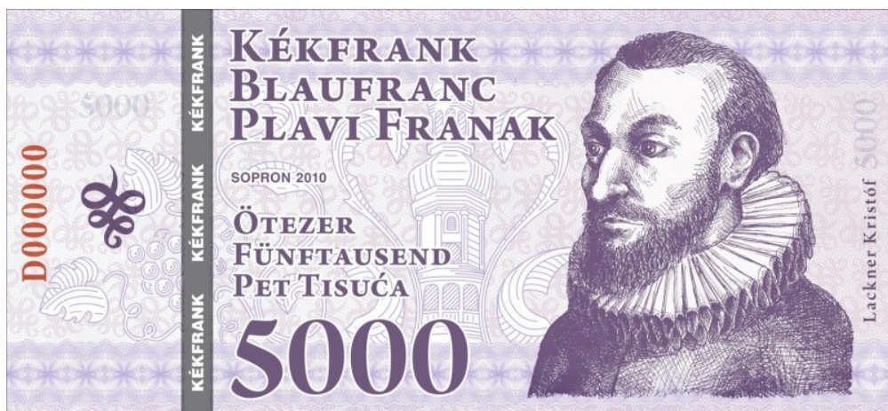
1. ábra Az ötezres címletű Kékfrank utalvány

A szövetkezeti tagok a Kékfrank utalvány elterjesztése érdekében kötelezik magukat arra, hogy vállalkozásaikban elfogadják, illetőleg csereeszközként használják a Kékfrankot. A szövetkezeti tag elsődlegesen a kibocsátó szövetkezet által megbízott pénzintézetben (szerződés alapján a Rajka és Vidéke Takarékszövetkezetben) juthat a Kékfrankhoz, azonos összegű forint befizetésével. A szövetkezet a Kékfrank forint ellenértékét kamatoztatja. Maga a Kékfrank nem kamatozik, ezért nem áll senki érdekében felhalmozása, ebből adódóan gyorsabban foroghat, mint a forint. Ez a remények szerint dinamizálhatja a helyi gazdasági életet, mivel felhasználói az egymás közötti cserét (részben) ebben bonyolítják. A soproni és a környékbeli vállalkozások könnyebben juthatnak megrendelésekhez, mivel a Kékfrank utalványokat tovább kell adni, és ez csak a rendszerhez csatlakozó helyi vállalkozók körében lehetséges. Magánszemélyek is hozzájuthatnak (például az őket alkalmazó vállalkozásokon keresztül) a Kékfrank utalványhoz, amellyel lebonyolíthatják vásárlásaikat az azt elfogadó helyi üzletekben.